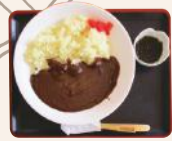
ウコン専門店が営む「健康茶屋」。ライスのウコンカレーのターメリックと、ダブルでウコンの入ったヘルシーな「ライスカレー」500円は、スパイスが効いた本格的な一杯。さらにヘルシーなことにも、もずく酢と日替りの健康茶(飲み放題)がついてくる。日替り定食などもあるランチは11:30~14:00。