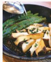
カスタムスタイルの「石窯焼き」は朝倉・糸島直送の「本日の野菜」(480円)や「本日の魚」(580円~)、「本日の肉」(600円~)、そしてソースを好みで運べる。

ピッツァリアナオ 福岡市博多区下川端町3-1博多バレインモール1F ☎092.409-8703 営業時間/11:00~23:00(22:30LO)、ランチ11:00~15:00 休/元日のみ