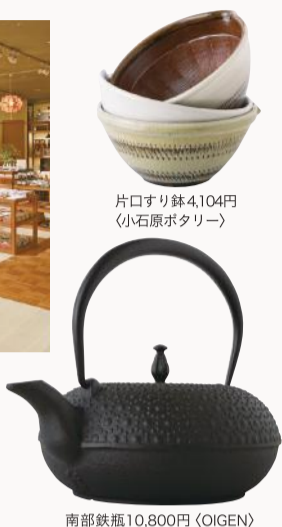
片口すり鉢4,104円 (小石原ポタリー)

時とともに練りあげられ、時代を超えた美しさをもつ道具たち。それはきつと、未来への道しるべとなる。