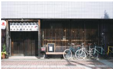
福岡レンタサイクルは、ゲストハウスに併設。「tokyobike」ならではの優しいカラーがまちに馴染む

高谷家Facebook https://www.facebook.com/takataniya