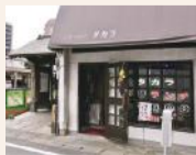
「北辰さん」の山門の脇に立つ昔懐かしいコーヒーハウス「タカラ」。「北辰さん」ご住職のご家族が営み、お祭りなどの世話をしている。日替り定食600円、ホットコーヒー400円。