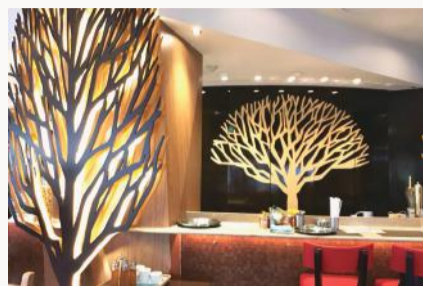
木を基調とした内装にリニューアル。デートや女子会にもオススメです。

自慢の本格ピッツァやパスタだけでなく、具材や調理方法を好みで選べる「カスタマイズスタイル」を楽しめる店として人気の「ピッツァリアナオ」。特に2種のピザ生地・4種のソース・約40種の具材からお好みでオーダーする「カスタムピッツァ」が評判で、個性的な私スタイルを追求するリビーターが増加中です。さらに、6月のリニューアルで、「石窯焼き」にもカスタマイズスタイルを拡大! 野菜・魚・肉など24種の食材と6種のソースからお好みの組み合わせをチョイスでき、ますます気軽にバルとして利用しやすくなりました。これからの季節はぜひ博多川に面したオープンテラス席でお楽しみください。