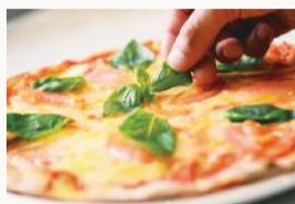
「カスタムピッツァ」はピザ生地+ソース(900円~)、トッピング(100円~)をチョイス。