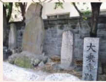
大乗寺跡に立つ石碑群は、一つは龜山上皇の「敵国降伏」の勅願石、一つは蒙古の軍船の礎石。隣の柳田神社には「菊池武時公奮戦の地」の案内がある。

冷泉通りから少し入ったところにある「博多の北辰さん」こと寶照院。北辰妙見とは天の中心にある北極星や北斗七星を信仰する仏教で、ご本尊の厨子の上には江戸時代の大工さんが病氣治癒のお礼に奉納した見事な「七つ星」の扁額がかかる。旧暦七夕(8/6)には夏祭りや辻祈禱が、12月23日は大黒天福迎祭でぜんざいのふるまいが行われ、最澄(伝教大師)作と伝わる大黒天像がご開帳となる。