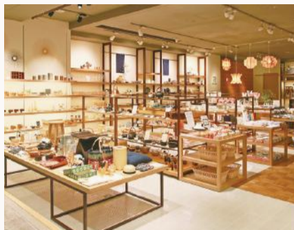
生活雑貨からインテリアまで、多岐にわたる商品のテーマは「日本のものづくり」。

tokineri 福岡市博多区下川端町3-1博多バレインモール1F ☎092.409-5566 営業時間/10:30~19:30 休/元日のみ