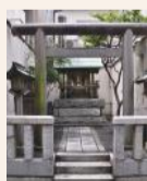
リノベーションミュージアム「冷泉荘」の隣にある、小さな小さな「川端大神宮」。