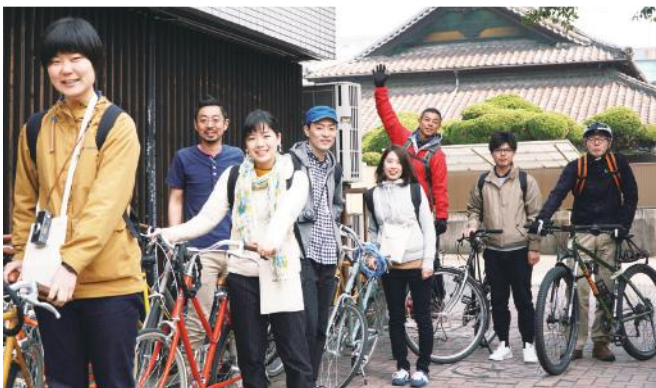
パンライドの模様。フェイスブックにはその日の様子も動画でもアップされているので、ぜひチェックしてみてください